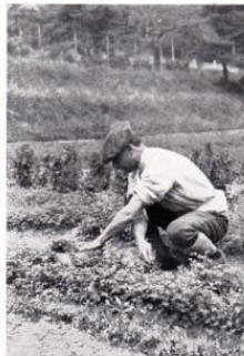
Malati al lavoro in gruppo ed isolati